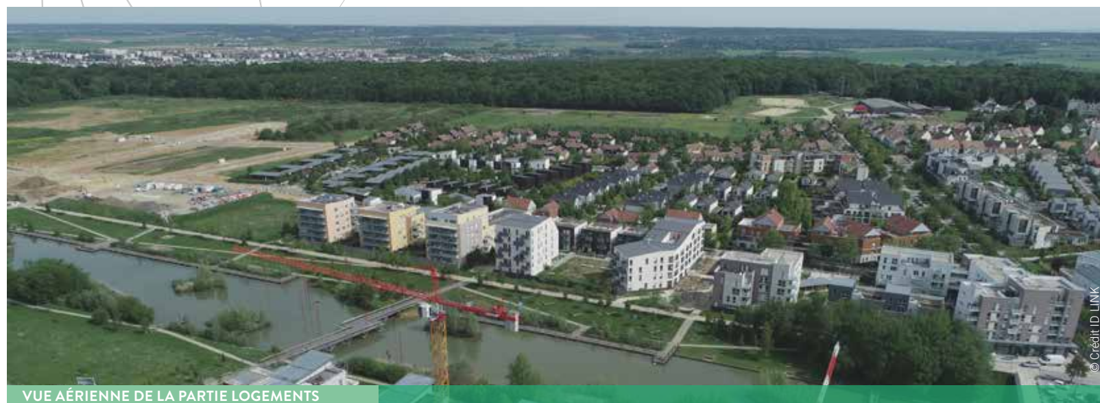
VUE AÉRIENNE DE LA PARTIE LOGEMENTS

A l'ouest de Bois d'Arcy, la Croix Bonnet est une partie de l'ancien domaine de Versailles dans laquelle un quartier équilibré prend forme autour du canal de la Rigole des Clayes. Ainsi, habitat, activités économiques, équipements publics et espaces paysagers s'insèrent entre la ville et la forêt. Un développement doux qui répond aux objectifs de la commune de proposer des logements pour tous et d'accueillir des activités économiques dans un cadre exceptionnel. Chance supplémentaire, le quartier est un lieu propice au développement de la biodiversité où de nombreuses espèces végétales et animales se sont installées.