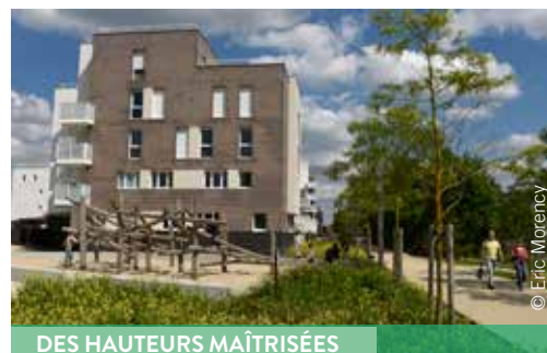
DES HAUTEURS MAÎTRISÉES

Un équilibre a été recherché au niveau des hauteurs. Les plus grandes constructions atteignent ainsi le niveau R+5. Pour les 400 logements à venir, les hauteurs seront davantage restreintes (R+2+attiques). La dernière phase d'aménagement de la ZAC est composée essentiellement de maisons individuelles en lisière de forêt.