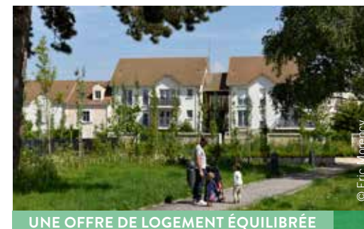
UNE OFFRE DE LOGEMENT ÉQUILIBRÉE

En 1995, la part de logements aidés sur la commune n'était que de 3,5%. Grâce aux constructions réalisées depuis, cette part a atteint 16,74% en 2012. A la Croix Bonnet, ce sont plus de 30% des 1 500 logements réalisés ou en cours de construction qui sont en location ou en accession sociale.