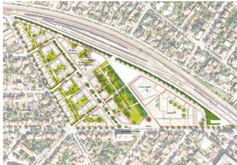
PLAN MASSE DU FUTUR QUARTIER

Situé à 12 kms de Paris, au cœur du quartier de la Varenne, le Jardin des Facultés est un futur écoquartier de 6,6 hectares dédié à la qualité de vie. Le parc arboré en constituera le véritable poumon vert. L'ambition du projet est de réaliser un quartier à taille humaine qui réponde à une exigence de qualité architecturale et paysagère forte, qui offre des équipements variés ouverts à tous les Saint-Mauriens, qui s'adapte aux différents besoins en logements et qui facilite les modes de déplacement doux pour un quartier apaisé et agréable à vivre.