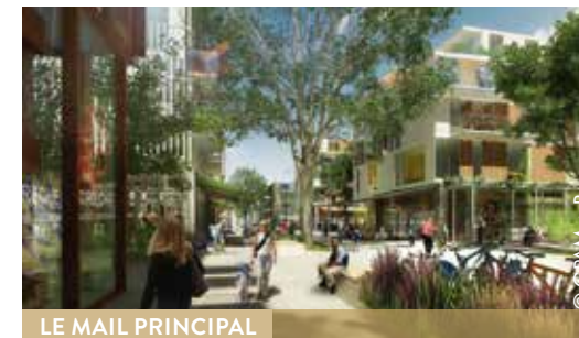
LE MAIL PRINCIPAL

Le Jardin des Facultés propose une grande diversité d'habitats répondant aux besoins de chacun avec des logements en accession, libre ou à prix maîtrisés, des logements locatifs sociaux, une résidence pour étudiants et une résidence pour personnes âgées.