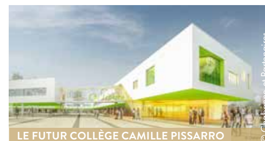
LE FUTUR COLLÈGE CAMILLE PISSARRO

Les habitants pourront bénéficier d'équipements de qualité, notamment scolaires ou sportifs avec la reconstruction du collège Camille Pissarro et du centre sportif Gilbert Noël. De nouveaux équipements seront par ailleurs créés : un parc de stationnement public, une crèche, une maison de santé, un centre aquatique ainsi qu'un parc et un mail piétonnier et commerçant développant une offre diversifiée d'activités familiales.