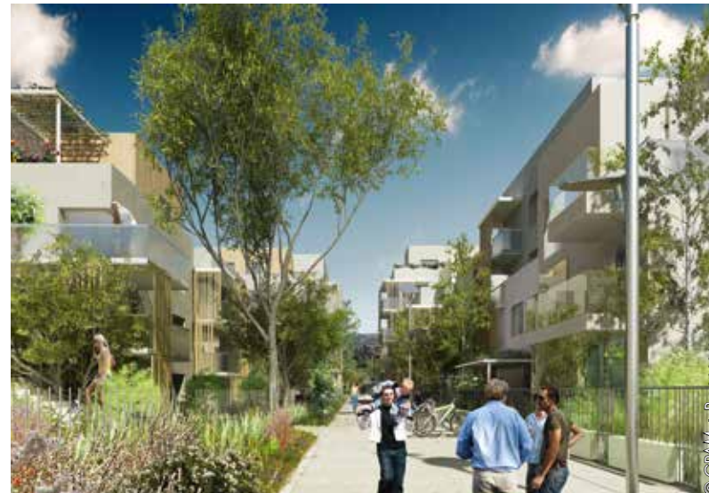
DES VOIES DÉDIÉES AUX PIÉTONS ET AUX CYCLISTES

Situé à 12 kms de Paris, au cœur du quartier de la Varenne, le Jardin des Facultés est un futur écoquartier de 6,6 hectares dédié à la qualité de vie. Le parc arboré en constituera le véritable poumon vert. L'ambition du projet est de réaliser un quartier à taille humaine qui réponde à une exigence de qualité architecturale et paysagère forte, qui offre des équipements variés ouverts à tous les Saint-Mauriens, qui s'adapte aux différents besoins en logements et qui facilite les modes de déplacement doux pour un quartier apaisé et agréable à vivre.