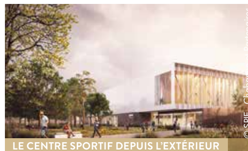
LE CENTRE SPORTIF DEPUIS L'EXTÉRIEUR

Véritable projet conçu sur mesure, le Jardin des Facultés s'intégrera naturellement au tissu résidentiel existant avec des bâtiments de hauteurs progressives et harmonieuses, s'insérant aisément dans le quartier pavillonnaire qui l'entoure. Ce nouveau quartier essentiellement piétonnier sera ouvert sur son environnement notamment grâce à son offre d'équipements variée.