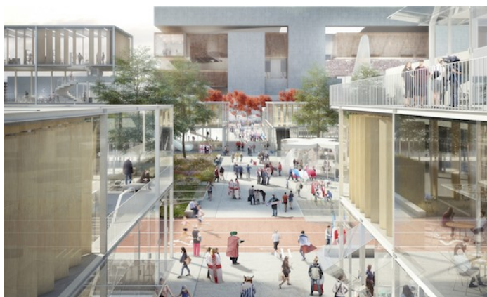
ZAC de Ris-Orangis. © AUC/CAECE

Cela ne peut être qu'une boutade, une « petite phrase » comme disent les journalistes. Ma fonction m'interdit de polémiquer, et je ne m'attarde pas sur les procès d'intention. Le seul hippodrome dont j'aie moi-même parlé depuis trois années que je préside l'ex-AFTRP, c'est l'ancien hippodrome de Ris-Orangis, en Essonne, qui est désaffecté et sur lequel un très beau projet de grand stade de rugby est porté par le mouvement sportif soutenu par les élus, et par nous-mêmes.